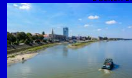
Kép 2. oldal

Magyarország utáni magyarországi utazás? Ungarn bereisen absieits Ungarn? 2. oldal