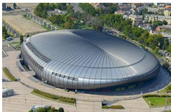
Papp László Stadion Budapest

Érezd jól magad, mondja a szerkesztőség! Club-InfoK (magyarul beszélő) Información I-Cosmos-America