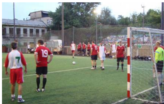
Kép: Tavasz bajnokságok Arany Ászok