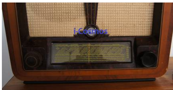
Régi rádió állomásinformációkkal

Közelbeli települések Kneževi Vinogradi és Bilje