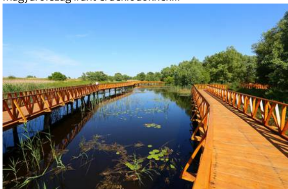
Kopački-Ritt bei Osijek